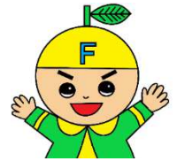
ふじかわ分校キャラクター ふんこちゃん