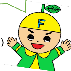
ふじかわ分校キャラクター ぶんこちゃん