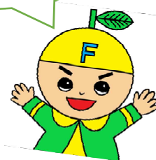
ふじかわ分校キャラクター ぶんこちゃん